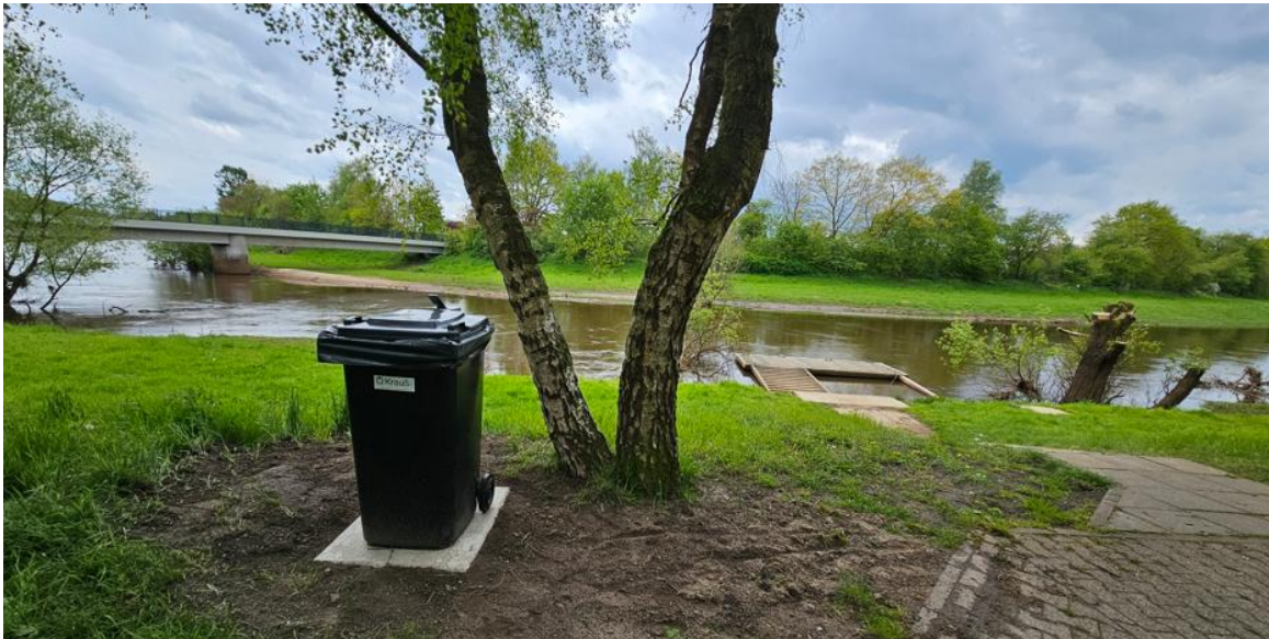
Bootsanleger Stadt Haselünne (oben)