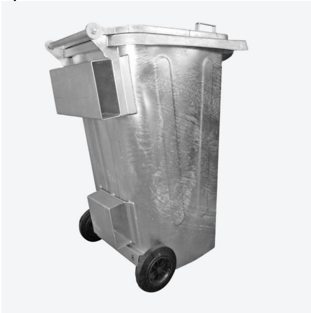
Stapertaschen für Drehkranzstapler