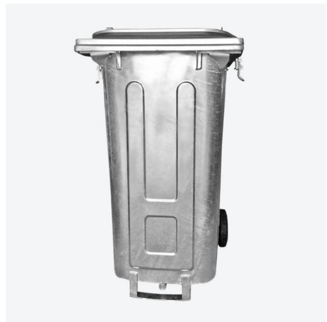
zusätzlich mit Öl-Ablass-Stutzen